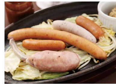
5種類のソーセージ盛り合わせ